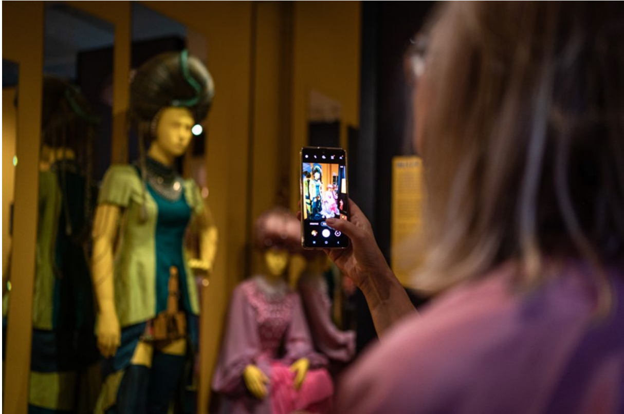
De tentoonstelling Zeur niet! over de musicals van Annie M.G. Schmidt en Harry Bannink.