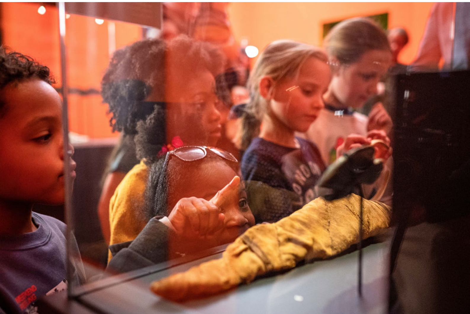
Een rondleiding in de tentoonstelling over oudegyptische dierenmummies