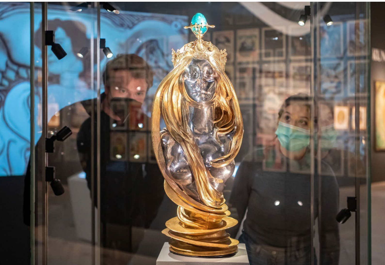
De tentoonstelling Göttinnen des Jugendstils in Karlsruhe, met rechts op de achtergrond ruim 40 covers van het tijdschrift Jugend uit de collectie van het Allard Pierson.