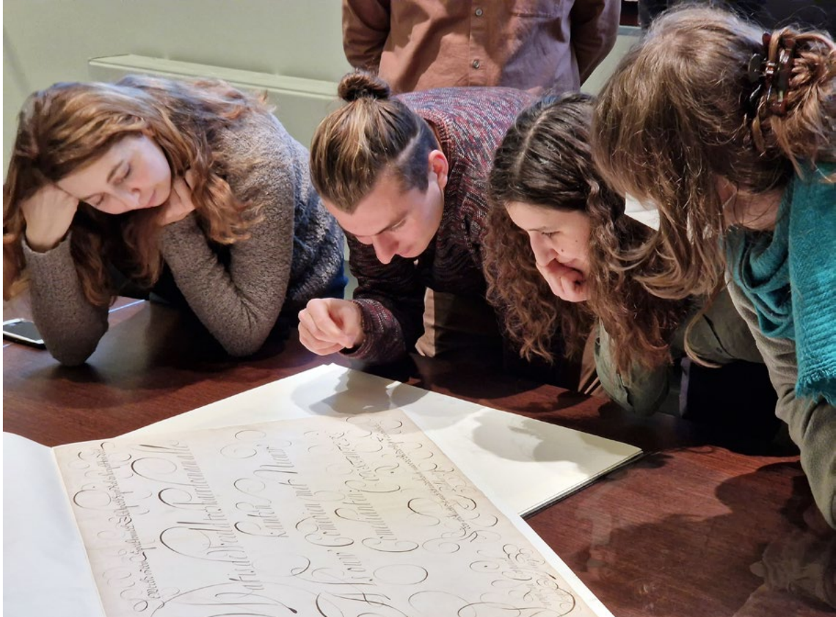
Studenten van de Koninklijke Academie van Beeldende Kunsten op bezoek bij de grafische collectie.