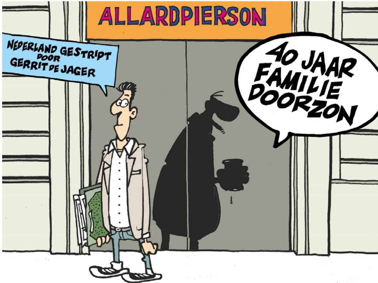
Publiciteit voor de tentoonstelling 40 jaar Familie Doorzon . Nederland gestript door Gerrit de Jager .