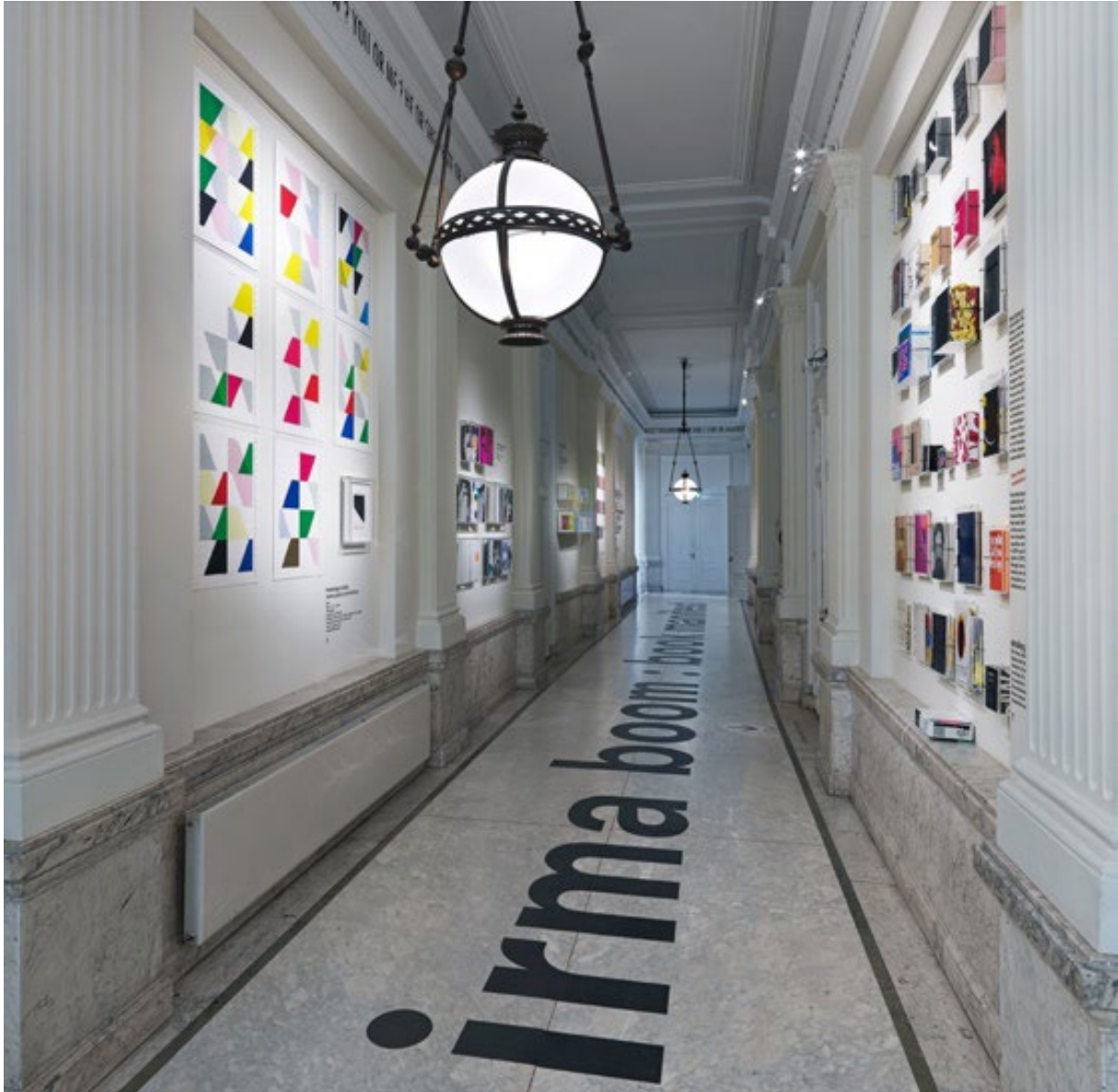
De tentoonstelling Irma Boom : Book Manifest , over het ontwerp- en productieproces van Booms boeken.