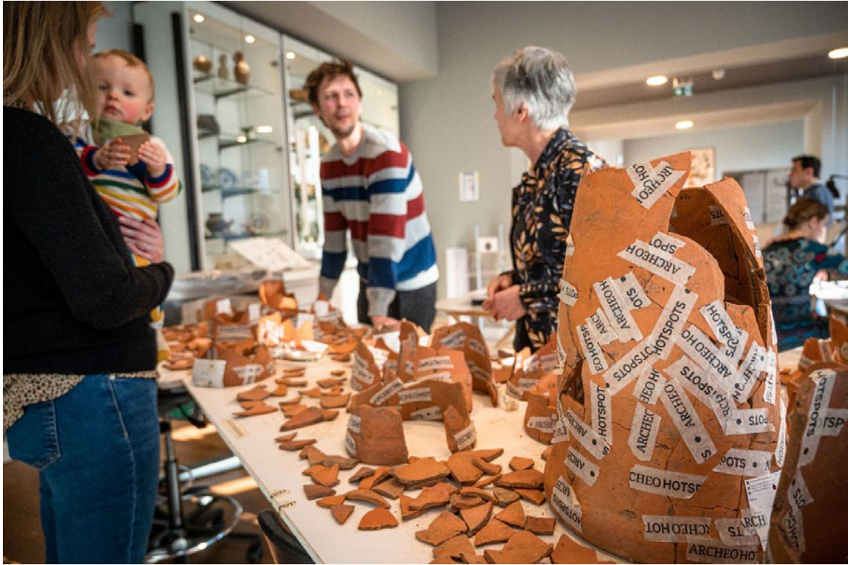
De ArcheoHotspot in het Allard Pierson, waar bezoekers zonder afspraak kunnen binnenlopen en meehelpen met het werk van een archeoloog